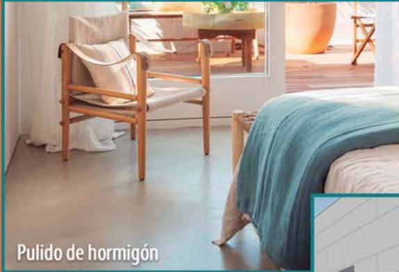
Pulido de hormigón