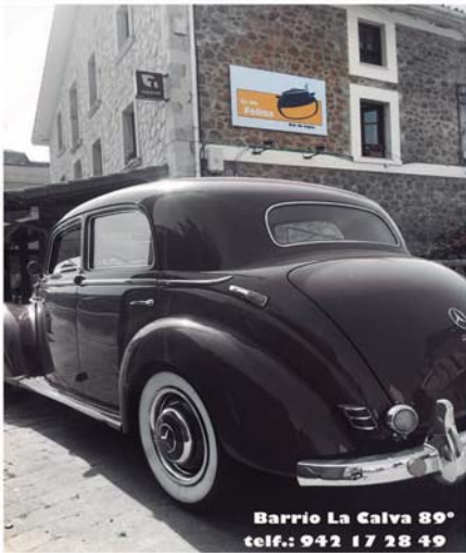
Barrio La Calva 89° telf.: 942 17 28 49