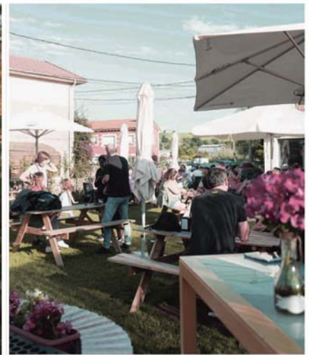
Bar de tapas