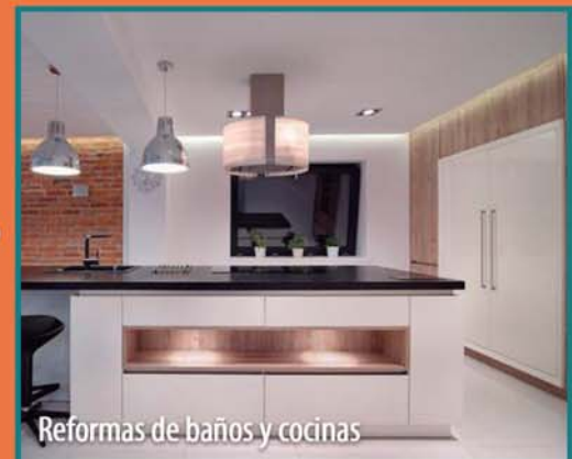
Reformas de baños y cocinas

Tu vivienda o local será único y mágico en ilustraciones 3D